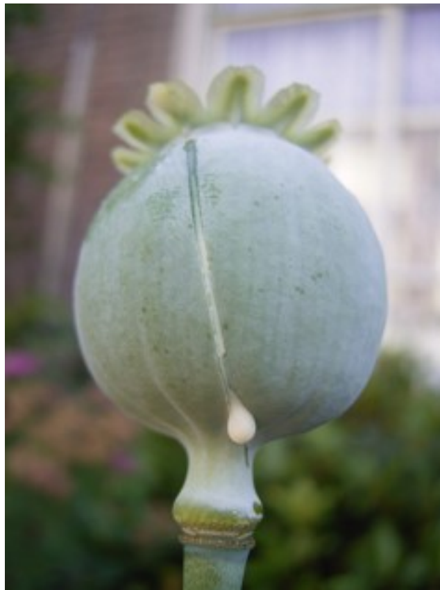
Abbildung 1: Samenkapsel von Papaver somniferum L., angeritzt mit aus tretendem Milchsafte, gemeinfrei, https://de.wikipedia.org/wiki/Datei:Opium_pod_cut_to_demonstrate_fluid_extraction1.jpg

Der Schlafmohn ( Papaver somniferum L.) ist der vielleicht berüchtigste Vertreter der Familie der Mohngewächse (Papaveraceae). Erstens sind seine reifen Samen als Würzmittel oder Backzutat bekannt, zweitens liefert er das bekannte Opium bzw. die Opiate, die in der Medizin Verwendung finden.