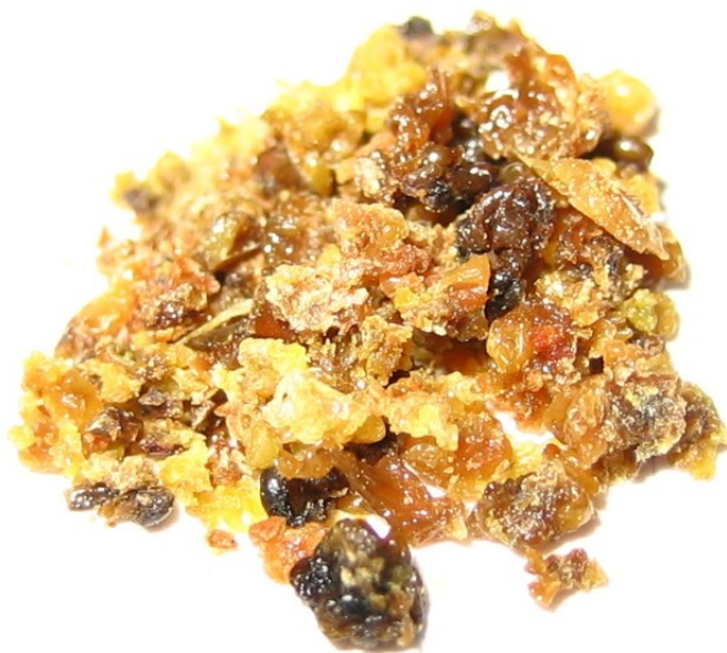
Abbildung 2: Rohopium

Um Rohopium herzustellen wird der weiße Milchsaft von unreifen Samenkapseln des Schlafmohns Papaver somniferum L. geerntet und an der Luft getrocknet. Die Ernte des Milchsafts geschieht durch leichtes Anritzen der Samenkapsel 12 (siehe auch Abbildung 1).